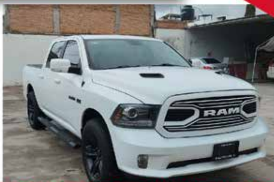
RAM 2500 CREW CAB R/T 4X4 2019 8 CILINDROS