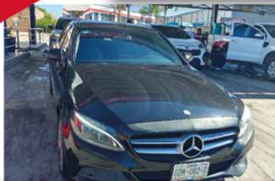
MERCEDES BENZ C200 2017